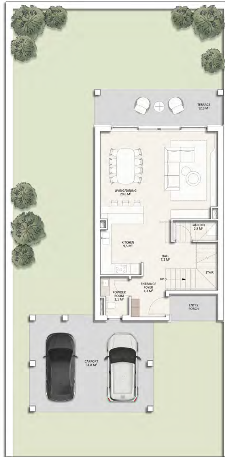
პირველი სართულის გეგმა