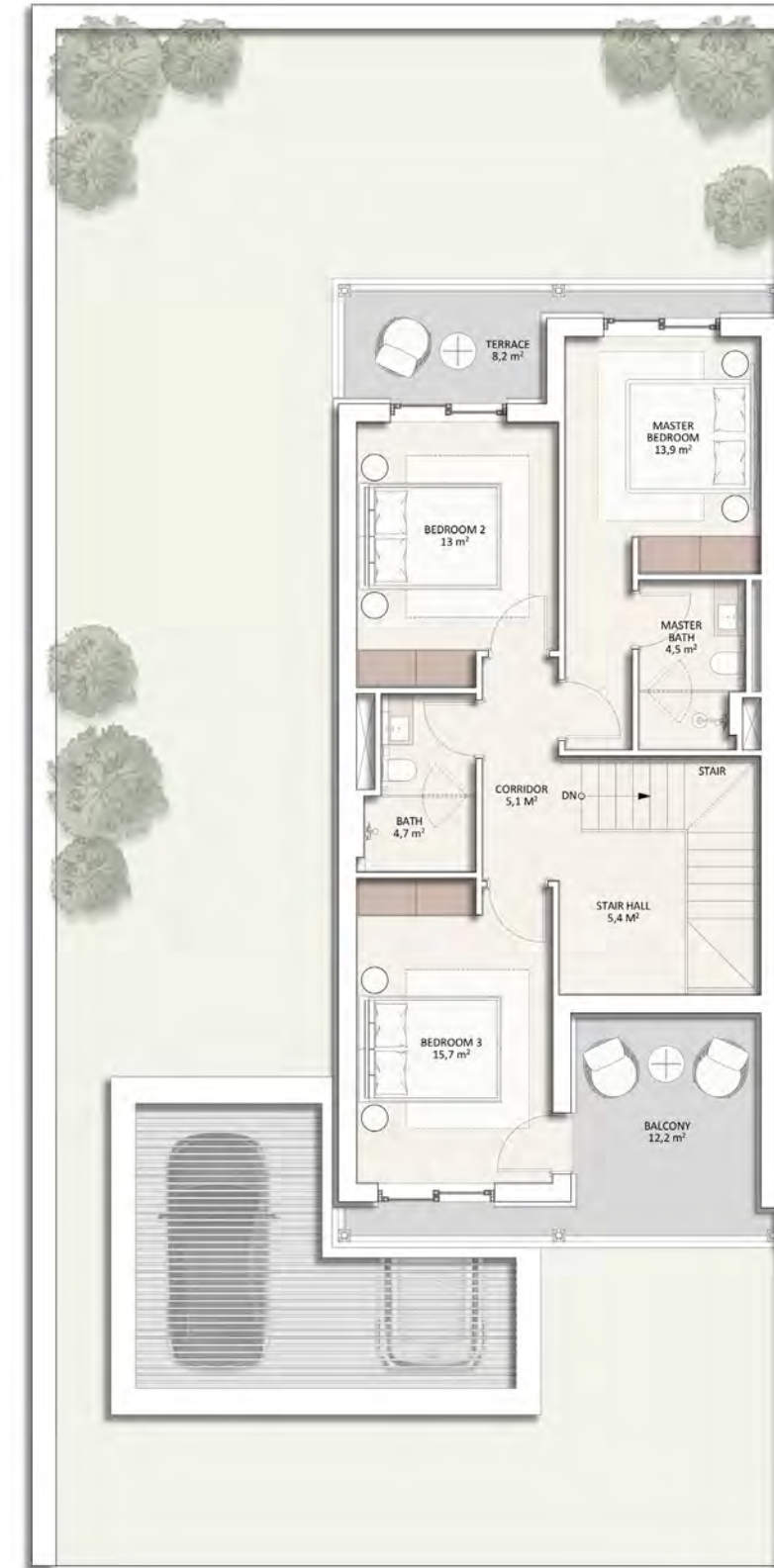
მეორე სართულის გეგმა

სრული სამშენებლო ფართობი 234 მ 2 საერთო ფართობი 202 მ 2