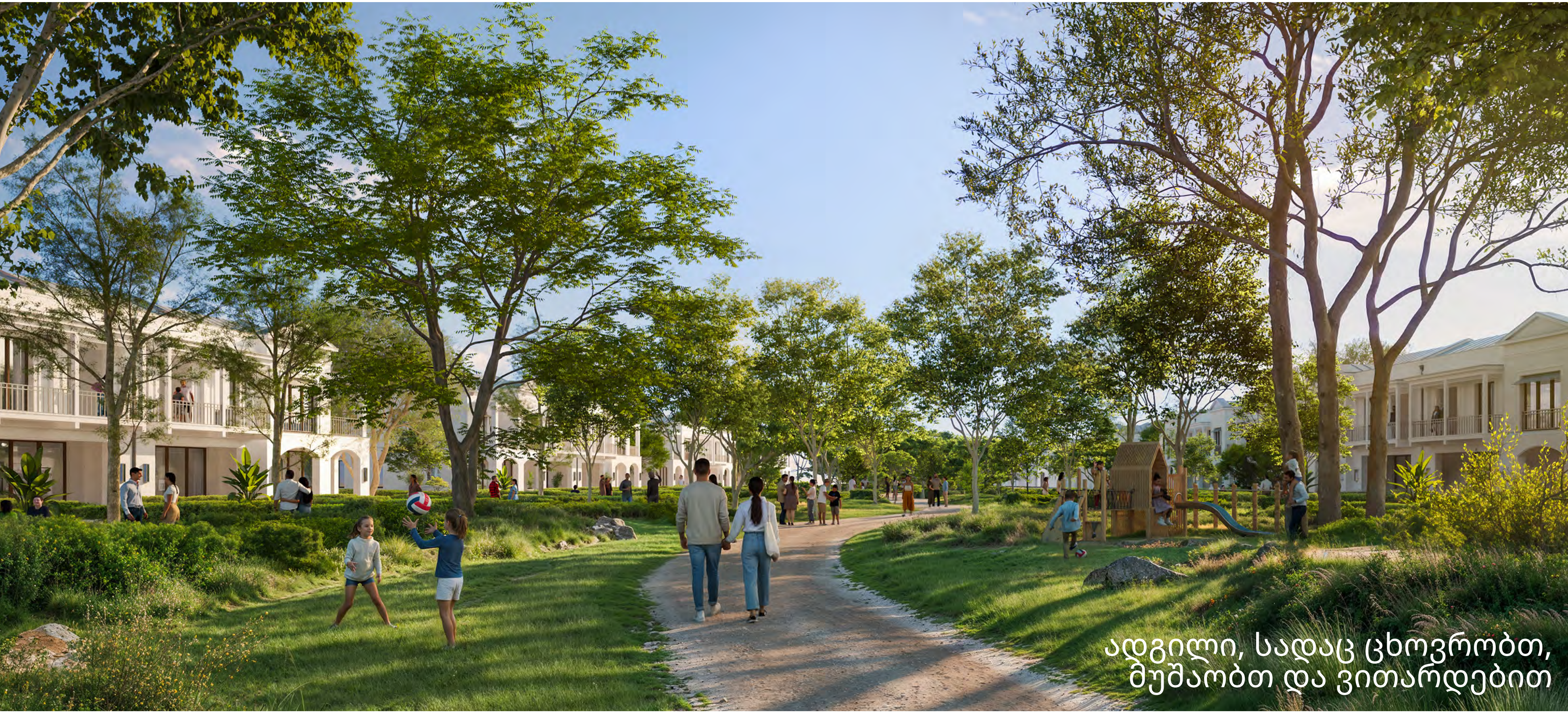
ადგილი, სადაც ცხოვრობთ, მუშაობთ და ვითარდებით