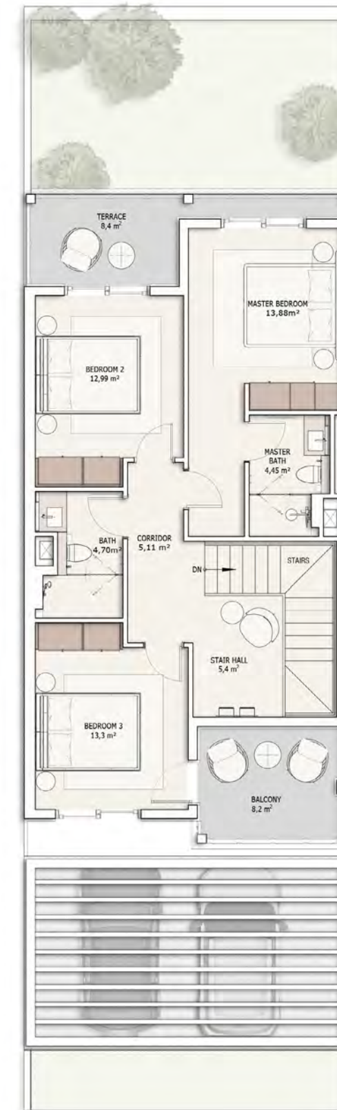
მეორე სართულის გეგმა

3 საძინებელი (მათ შორის 1 ინდივიდუალური სველი წერტილით)