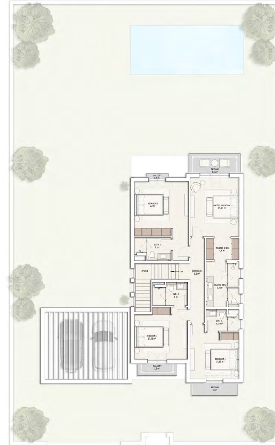
მეორე სართულის გეგმა