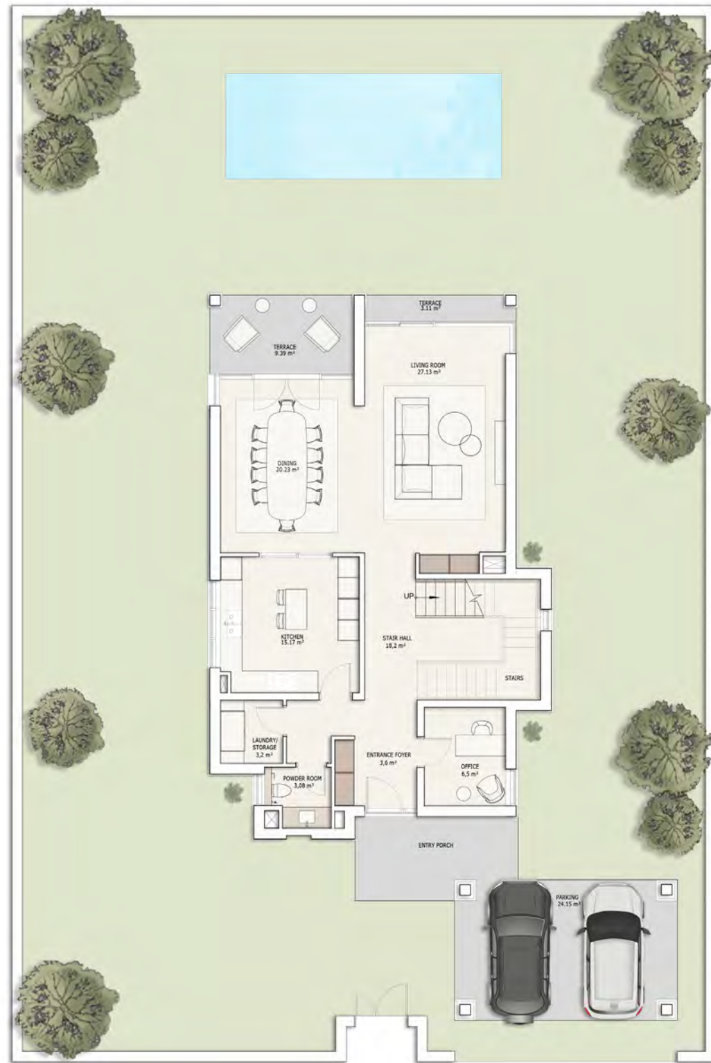
პირველი სართულის გეგმა