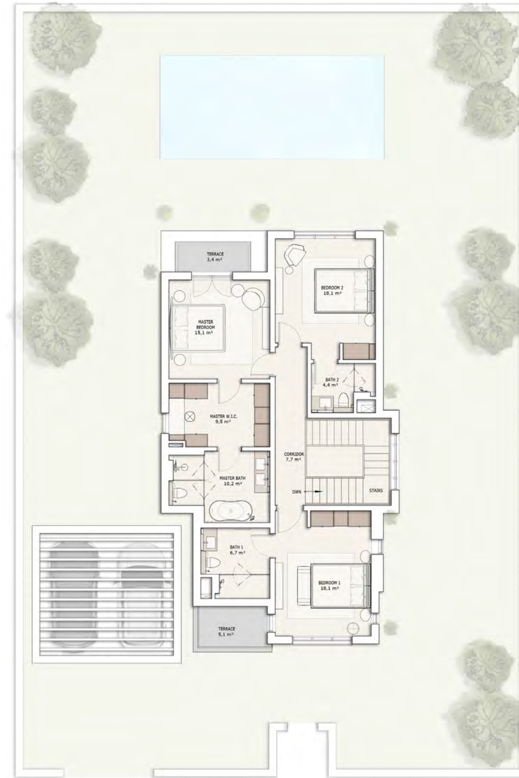
მეორე სართულის გეგმა