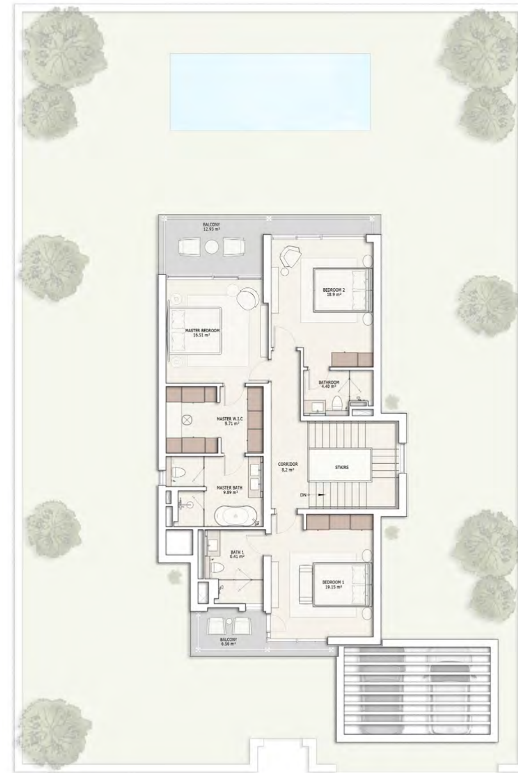
მეორე სართულის გეგმა