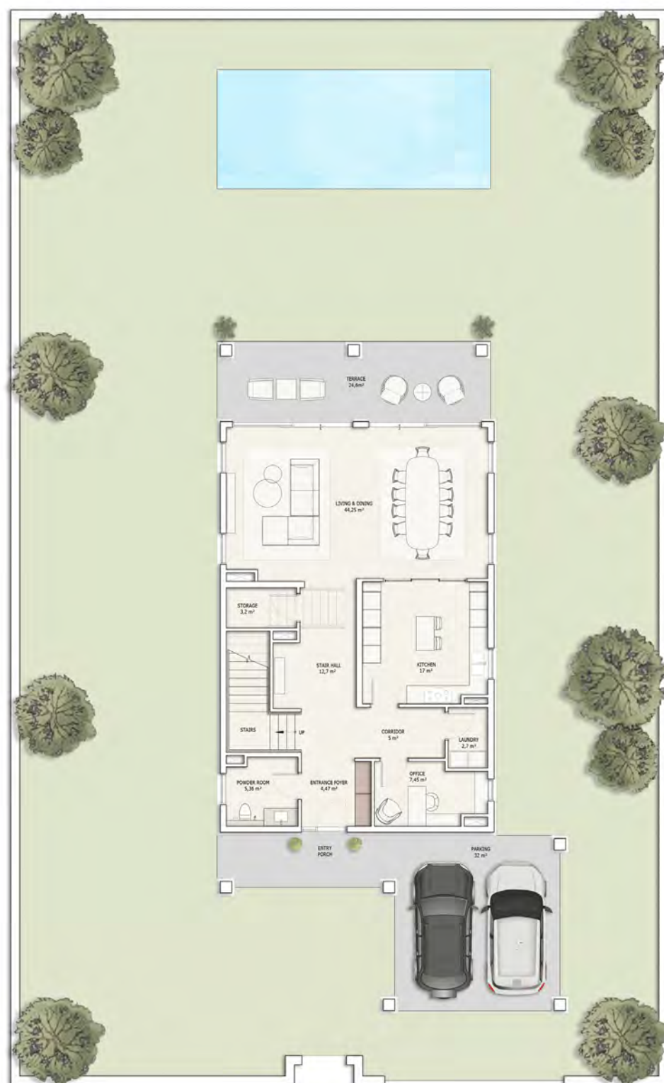
პირველი სართულის გეგმა