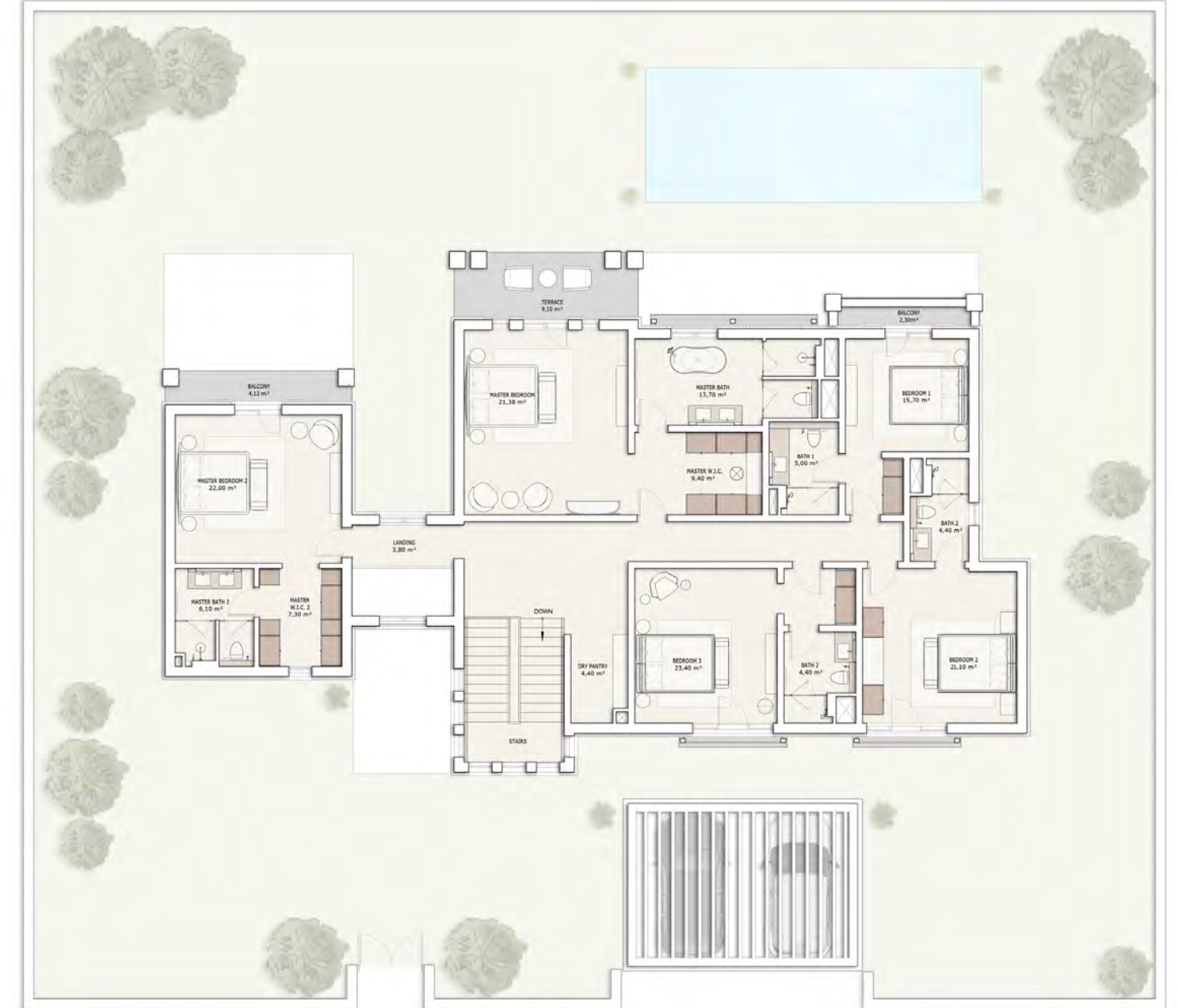
მეორე სართულის გეგმა