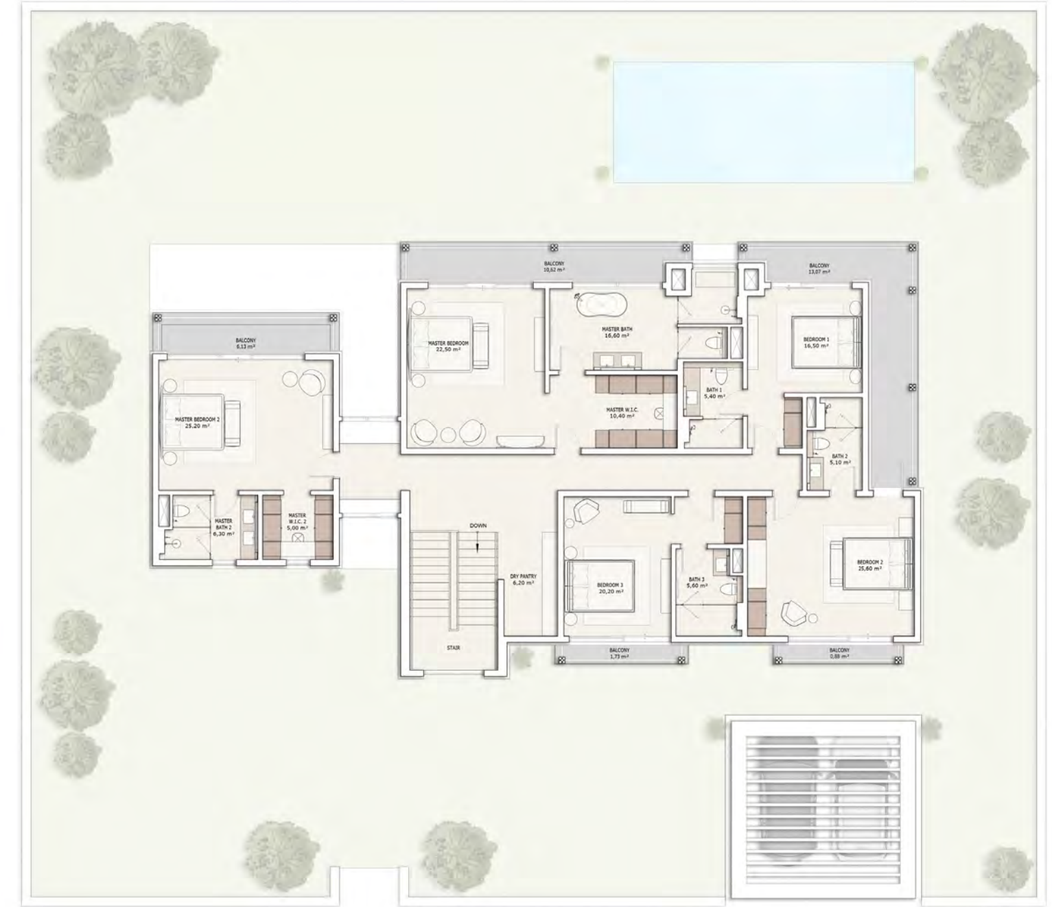
მეორე სართულის გეგმა