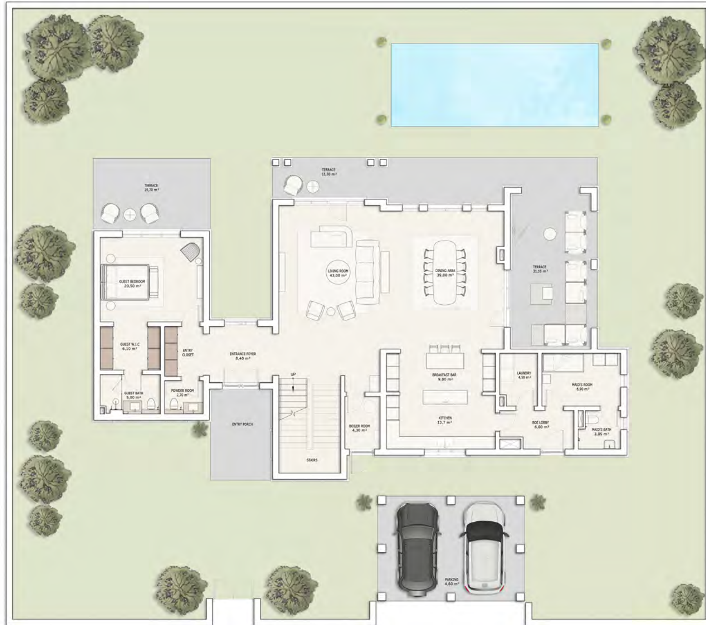
პირველი სართულის გეგმა