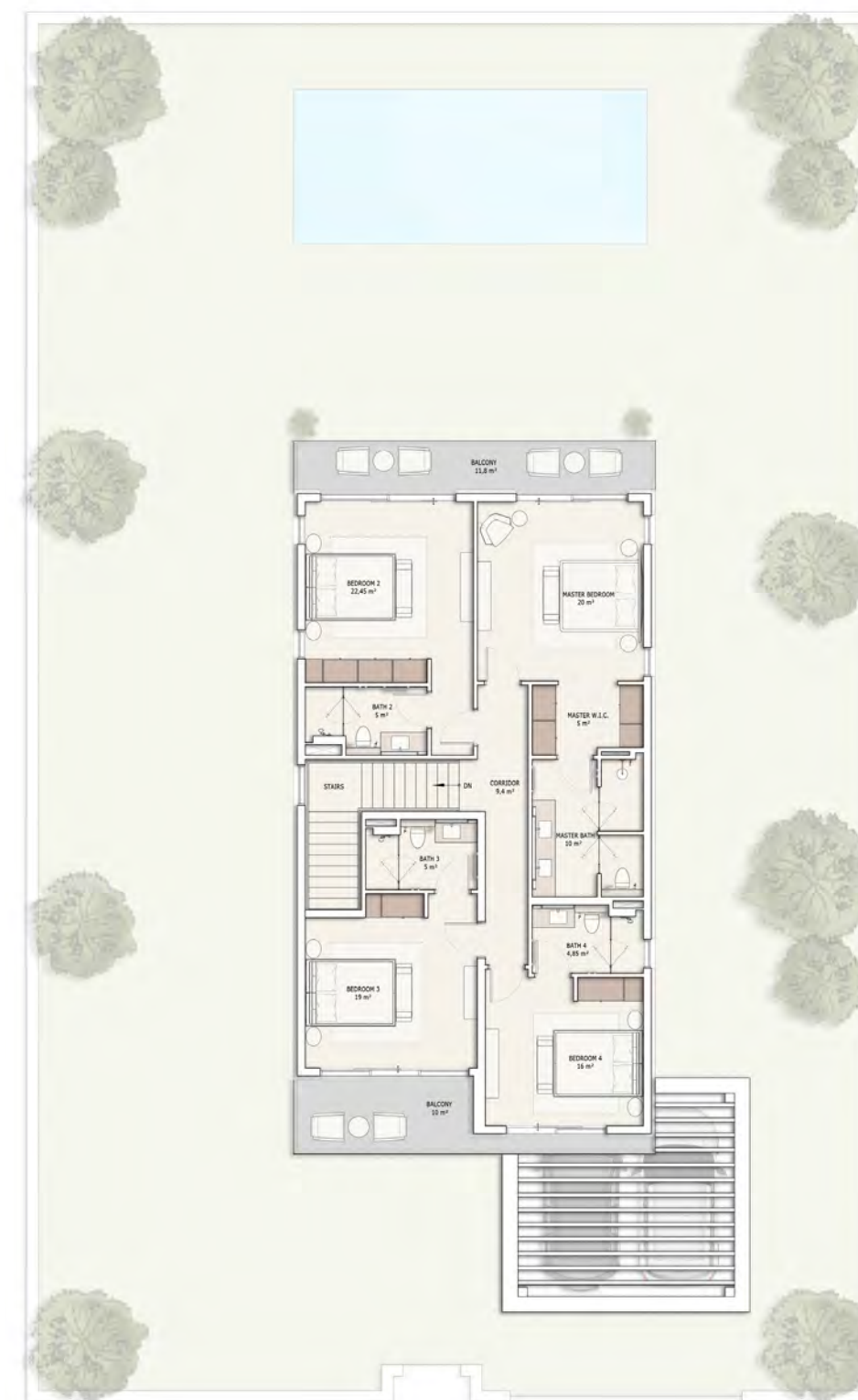
მეორე სართულის გეგმა