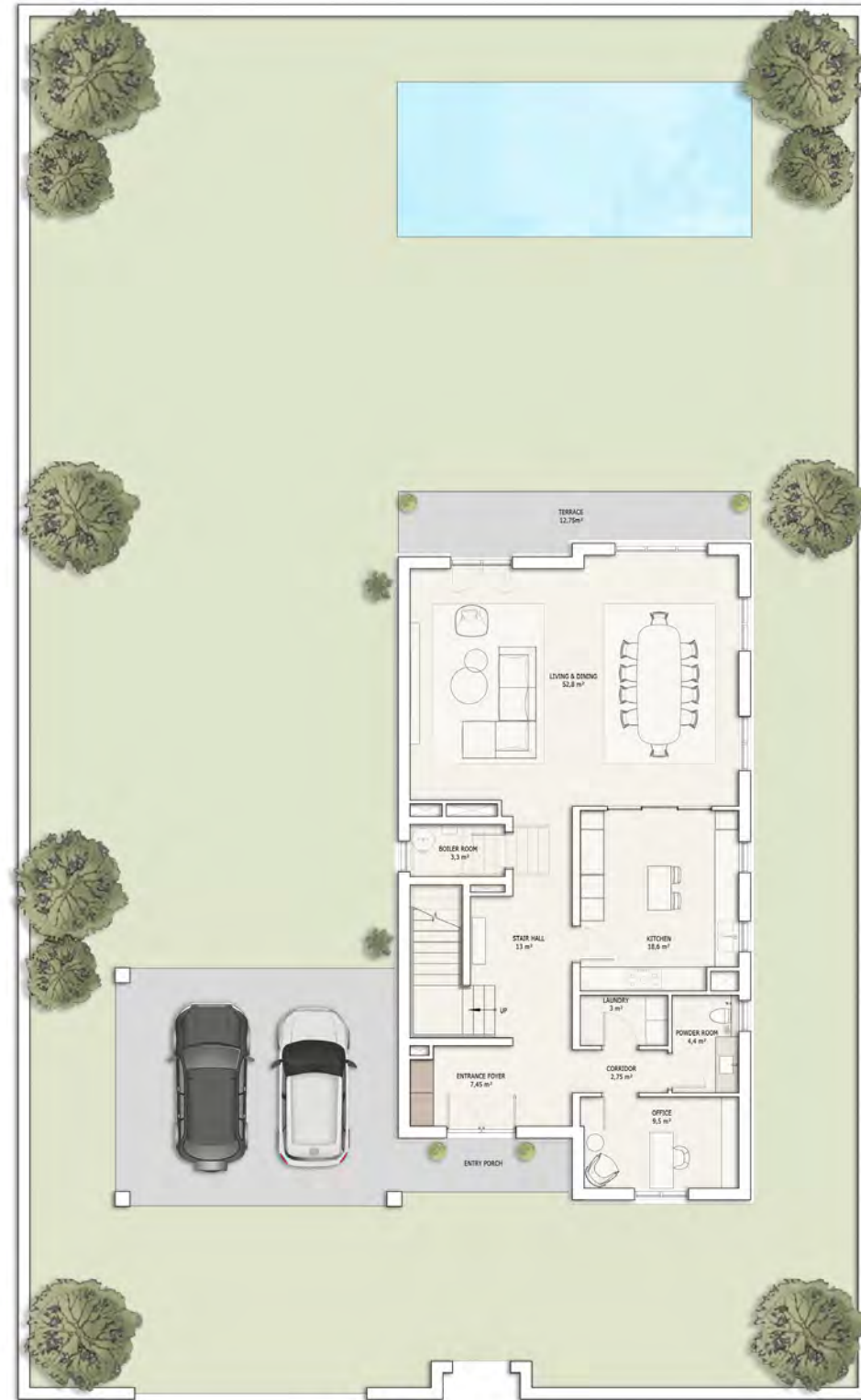
პირველი სართულის გეგმა

4 საძინებელი (ინდივიდუალური სველი წერტილით)