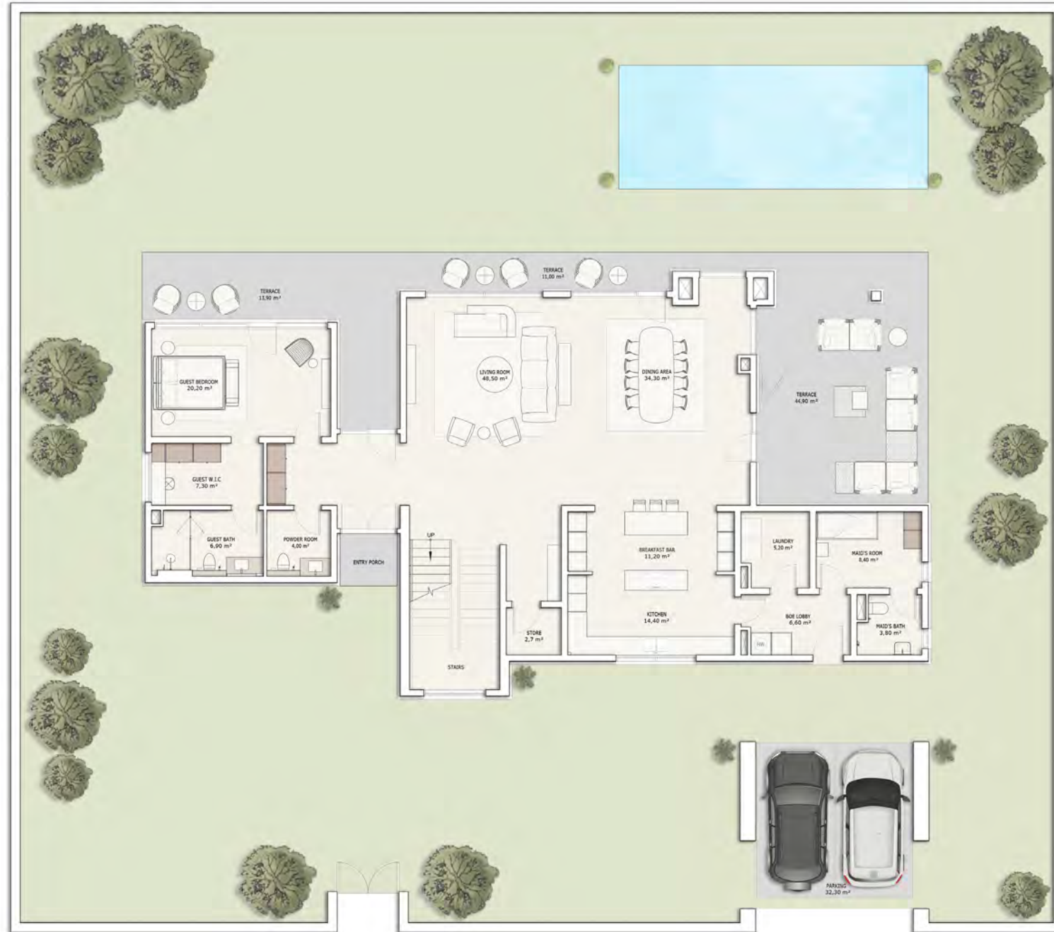
პირველი სართულის გეგმა