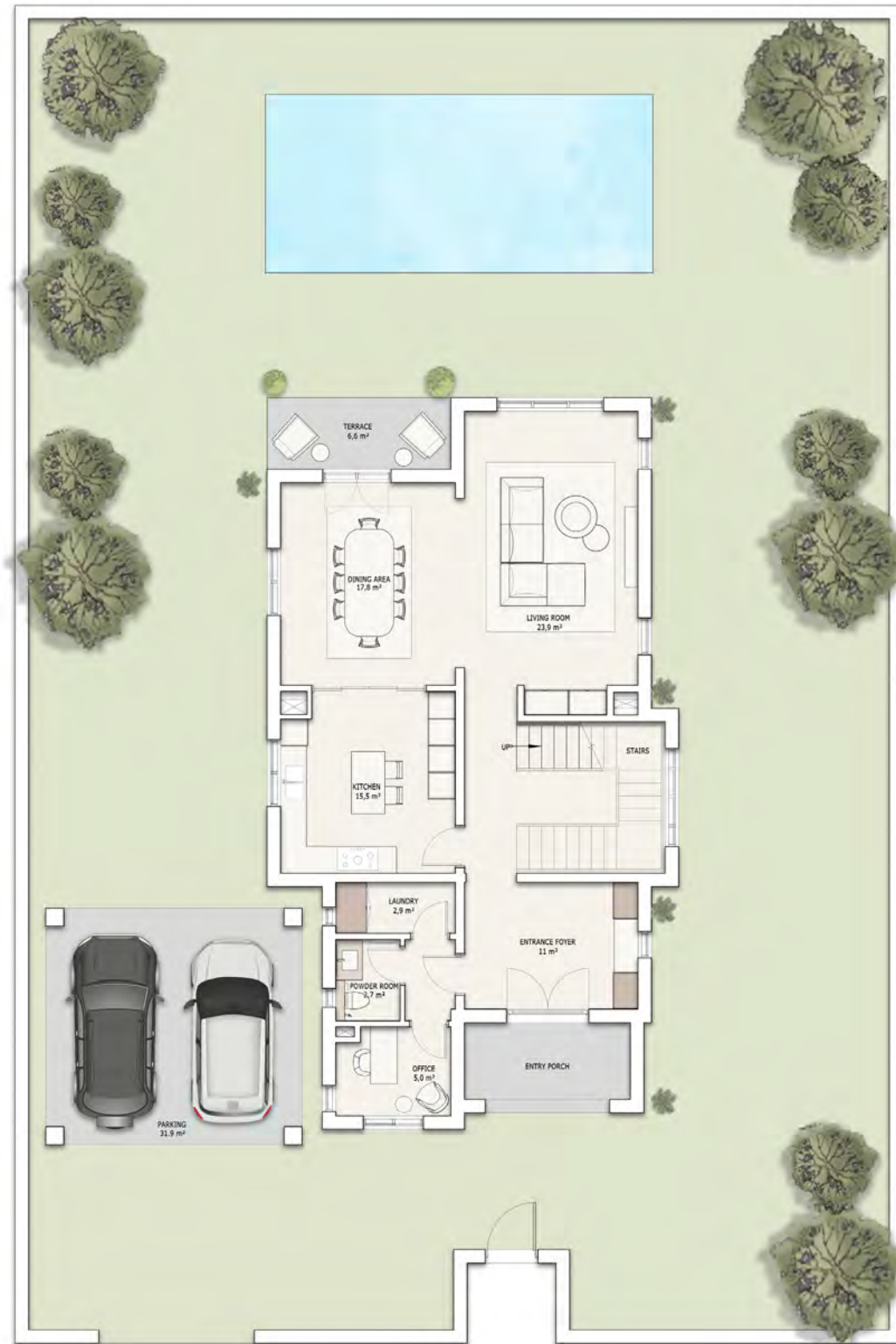
პირველი სართულის გეგმა